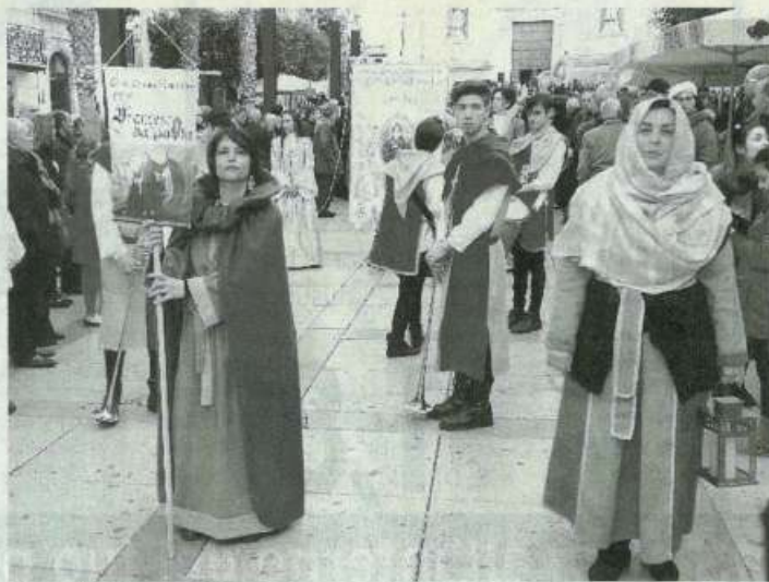
Alcuni dei figuranti

●●● Ha ricevuto numerosi apprezzamenti, il primo Corteo storico rievocativo sulla vita di San Francesco di Paola, evento molto coinvolgente che è stato realizzato dalla parrocchia San Francesco di Paola, che in questi giorni porta avanti i festeggiamenti in onore del Santo (la ricorrenza viene chiamata "Festa di lu Santu Patri"), e dall'Associazione culturale Trapani Medievale ad Alcamo domenica scorsa. "È la prima manifestazione del genere che si realizza in Italia", affermano gli organizzatori. Una lunga rappresentazione con il corteo composto da figuranti in abiti storici, musicisti e sbandieratori, in collaborazione con l'associazione "Trapani: tradumari&venti" e con la partecipazione anche dei cortei storici della provincia di Palermo e del gruppo di Musicisti e Sbandieratori "I Giovani del Castello" di Vicari (Palermo). Si è partiti dalla parrocchia San Fran-